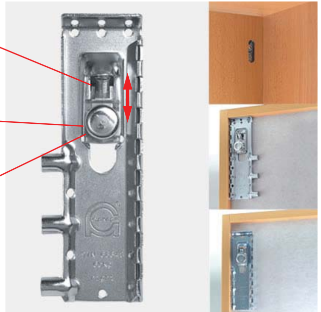
Ansicht der Aufhängung von hinten.